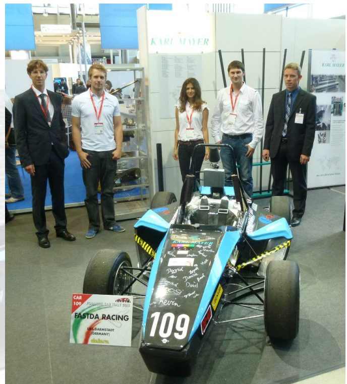
Abbildung 1 FaSTDa bei Karl Mayer in Stuttgart

Gerne möchten wir uns bei Karl Mayer nochmals auf diesem Wege bedanken für die Möglichkeit unser Fahrzeug dort auszustellen sowie die Einladungen zu der Messe.