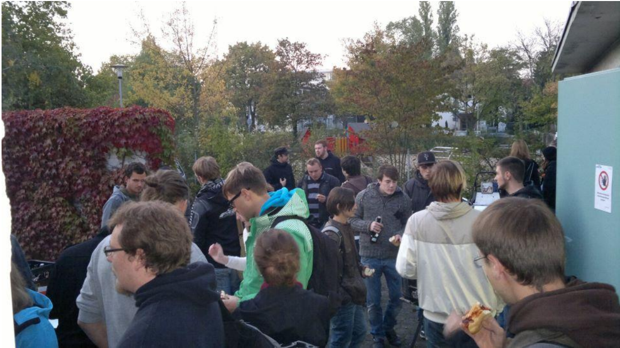
Abbildung 3 "Kennenlern"-Grillen an der Garage

Zusammenfassend muss man sagen, dass wir in diesem Semester sehr gut auf uns aufmerksam machen konnten und nun viele neue Studenten haben, welche sich für das Projekt interessieren. Die Aufgabe in der nächsten Zeit wird es sein, diese entsprechend in das Team zu integrieren.